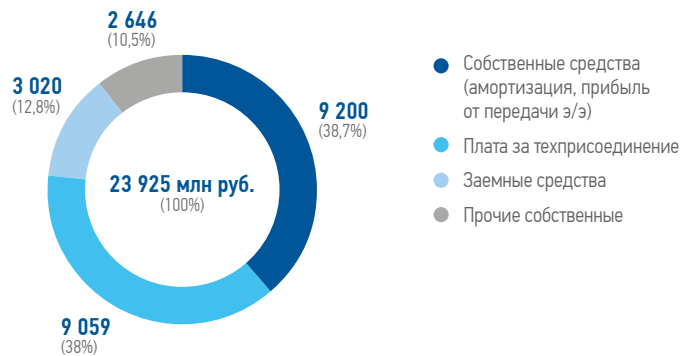
Структура финансирования капитальных вложений за 2022–2024 годы (млн руб.)